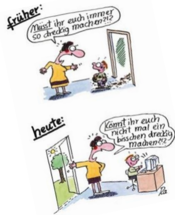
Foto fürs Internet

Die Hort- und Kernzeitbetreuung bietet allen interessierten Eltern einen Informationsnachmittag im Frühsommer an. Der Termin wird rechtzeitig kommuniziert.